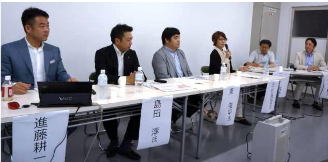
17 : 20-17 : 30 江別市長 挨拶