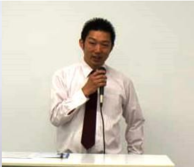
③12 : 35-12 : 45 FM shimizufarm ④12 : 45-12 : 55 (株)輝楽里 (ISS 北海道事業協同組合)