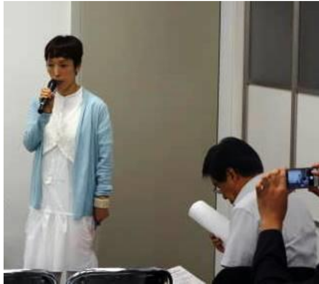
①12 : 15-12 : 25 江別製粉(株) 専務取締役 12 : 25-12 : 35 ノースライブコーヒー